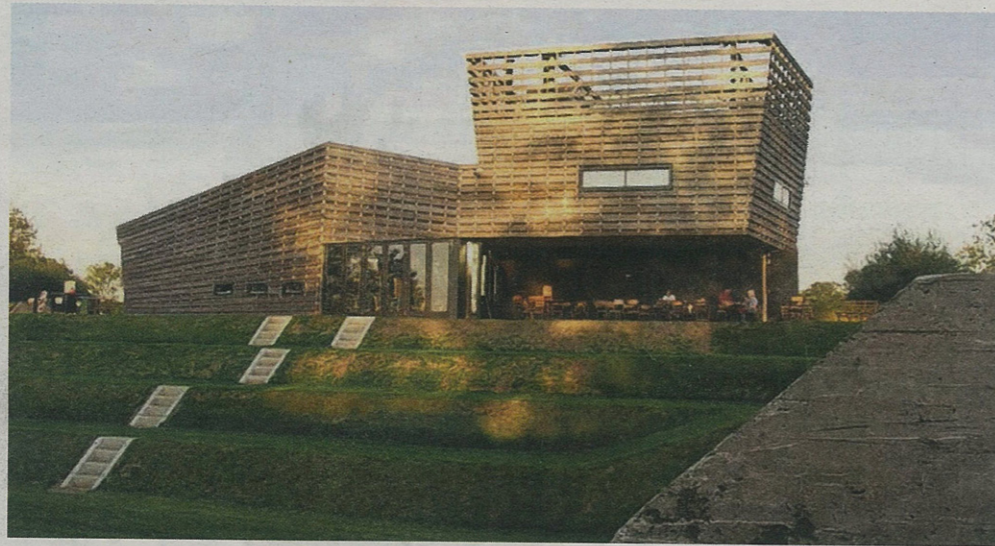
Het Forthuis (2011)

Culemborg, veldkeuken.nl Architect: Gent & Monk architecten Het Forthuis in Culemborg staat bij Fort Werk aan het Spoel, cultureel erfgoed van De Nieuwe Hollandse Waterlinie. Het idee achter de nieuwe horecagelegenheid, gebouwd in opdracht van de gemeente, is om een publieke functie aan het complex te geven. De vorm