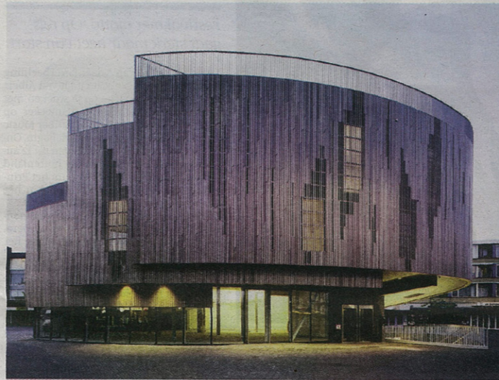
't Paviljoen (2009)

Nieuwe Markt, Roosendaal, paviljoenroosendaal.nl