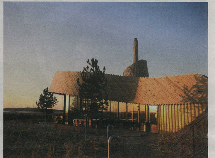
Aan Zee (2011)

rage is aangelegd, is voortaan autovrij. Omdat er twee keer per week markt is en er dan geen stoelen op het plein mogen staan, bedacht architect René van Zuuk om het ovale gebouw als een trap op te laten rijzen vanuit het plein. Het zo ontstane dakterras biedt bovendien uitzicht over de Nieuwe Markt.