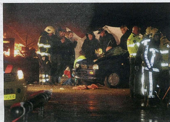
Tijdens Oud en Nieuw reed een automobiliste in op een groep toeschouwers die naar een vreugdevuur keken.