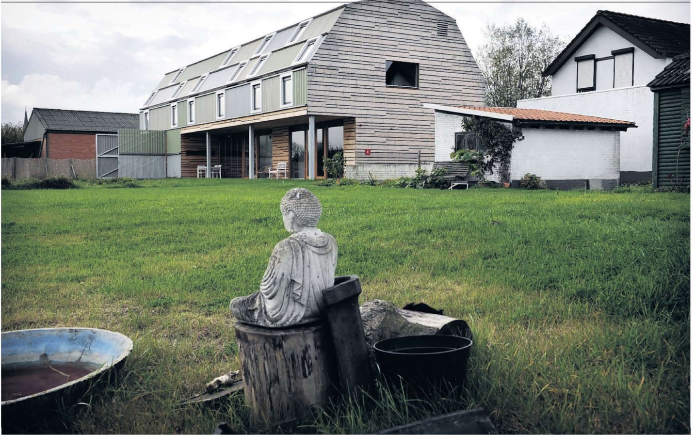
Bij de bouw van retraitecentrum Mette Vihara is voornamelijk golfplaat gebruikt, het meest verkochte bouwmaterial in Zeeland.