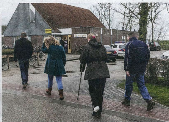
Dorpsbewoners komen dinsdag naar het dorpshuis om meer bijzonderheden te vernemen over het ongeluk.