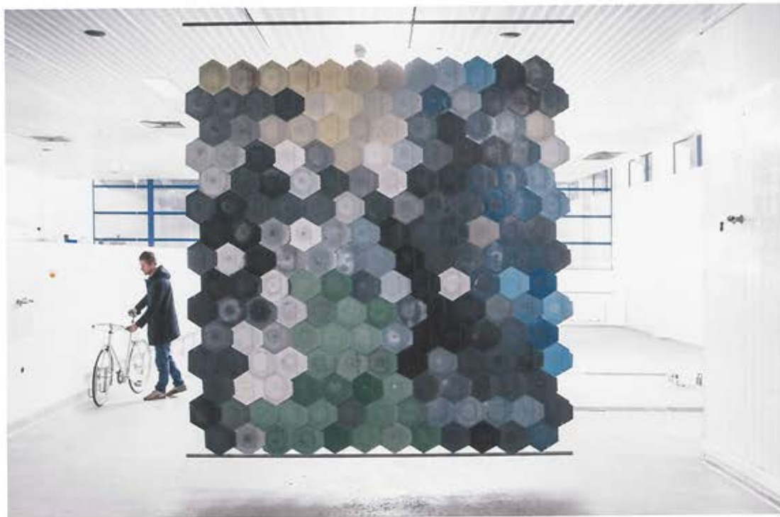
Nominatie De wijze waarop hergebruik van plastic leidt tot het agenderen van de manier waarop plastic wordt geproduceerd, was voor de jury reden voor nominatie van Pretty Plastic Plant door Bureau SLA en Overtreders w.

De architectuur en de bouw hebben meer dan ooit behoefte aan innovatie om maatschappelijke kwesties te adresseren