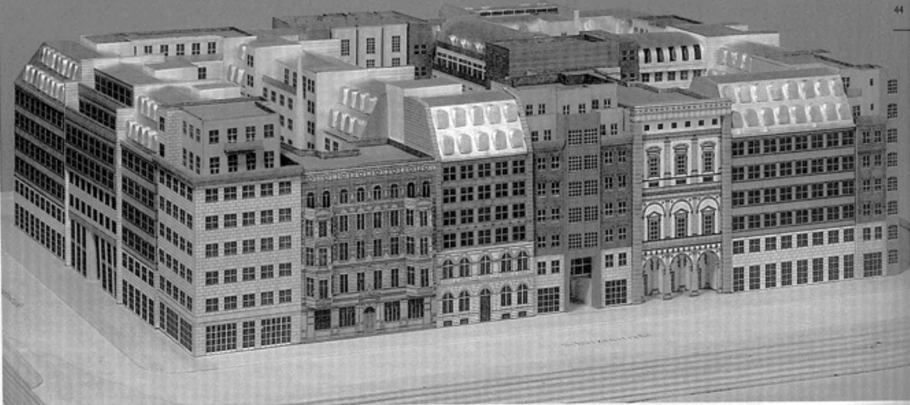
Aldo Rossi, project voor de Schützenstrasse, Berlijn.

Berlijn is de schok van de Duitse eenwording op 3 oktober 1990 nog steeds niet te boven. In de eerste jaren heerste er vooral euforie over de nieuwe mogelijkheden in de 'grootste bouwput van Europa'. Na zes jaar bouwwoede is de stemming omgeslagen in verwarring en ontzuivering. De bouwactiviteiten gaan eindeloos door, ogenschijnlijk zonder enig beleid en het beeld in grote delen van de stad wordt bepaald door architectonische missers.