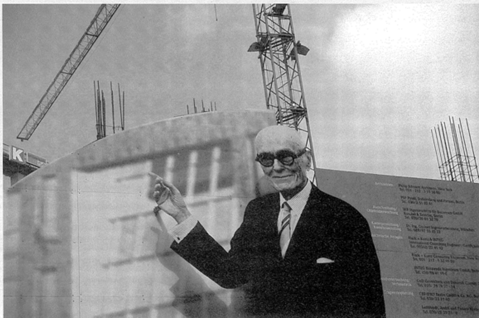
'Hier komt een Philip Johnson!' 'One Philip Johnson on the way!'

Architecten Philip Johnson Architects, New York Tel. 914 212 3115 36 80 P/O Pruitt, Stollberg and Partners, Berlin Tel. 030 451 05 81 Architectenbüro Christophers, Berlin Tel. 030 451 05 81 Architectenbüro Kohn & Tschudi, Berlin Tel. 030 451 05 81 Dr. Ing. Conrad Ingenieurbau, Munchen Tel. 089 91 55 05 23 Rack + Rott & Rott International Consulting Engineers, Karlsruhe Tel. 07242 72 41 93 Rack + Rott Consulting Engineers, New York Tel. 914 212 3115 36 80 INTEC International Engineers GmbH, Berlin Tel. 030 451 05 81 Gottlieb-Gottlieb und Partner, Karlsruhe Tel. 07242 72 41 93 CEP-INGE Berlin GmbH & Co. KG, Berlin Tel. 030 23 19 40 Lentzsch, Jandt und Partner Berlin Tel. 030 451 05 81