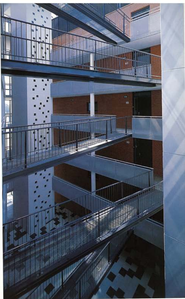
Het atrium. The atrium.