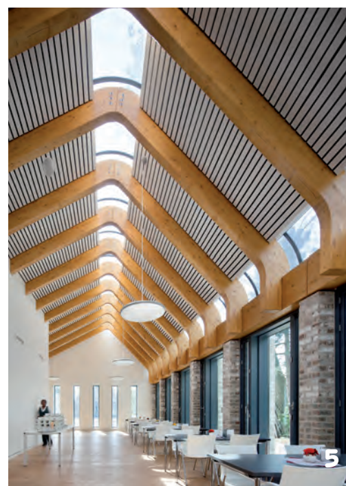
4-8. Noorderbegraafplaats Amsterdam, ontwerp Herman Zeinstra van Dok architecten en Gianni Cito van Moke Architecten • Foto's Thijs Wolzak / Moke. 4. De aula is opgebouwd uit hout en glas. 5. Koffiekamer. 6. Daglicht kan naar binnen stromen en aanwezigen kunnen ook de buitenwereld zien vanuit de aula. 7. Aanzicht vanaf de poort. 8. Met glas overdekte colonnades verbinden de verschillende bouwvolumes.