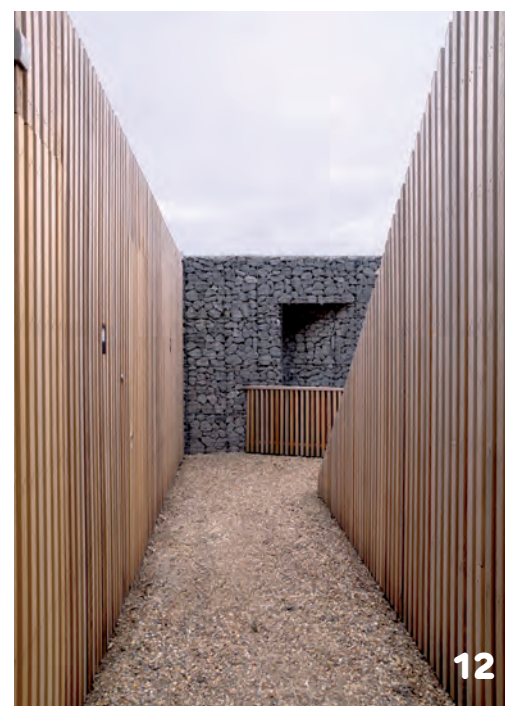
9 en 10. Afscheidsruimte op begraafplaats Oude Landen in Nuenen, ontwerp Van den Pauwert Architecten. Door een uitsparing in het dak valt strijklucht naar binnen, aan die kant is de binnenzijde van de cortenstalen luifel afgewerkt met messing. 11-14. Uitbreiding van begraafplaats Duinhof bij Lisse, ontwerp Bureau SLA en P2 Landschapsarchitecten. Keerwanden van met stenen gevulde schanskorven begeleiden de kunstmatige hoogteverschillen. Aan de buitenranden van de nieuwe terpen zijn bovengrondse muurgraven gemaakt • Foto's Francois Hendrickx. 15-18. De Nieuwe Ooster Amsterdam, Bierman Henket architecten. 15, 17 en 18. Kantoor en rouwcentrum • Foto's René de Wit. 16. Crematorium • Foto Teo Krijgsman.