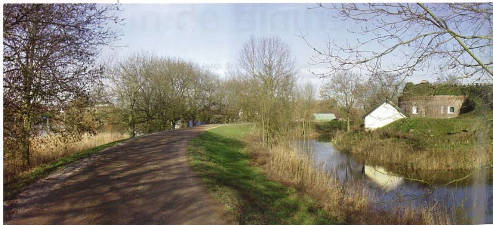
Fort Asperen (bureau SLA).

waterplas is alleen in tijden van oorlog zichtbaar. In vreedetijd staat er geen hek omheen, is de samenhang tussen de verschillende inundatievelden voor een niet-geschoolde waarnemer slecht zichtbaar en liggen de forten (om militair voor de hand liggende redenen) verborgen in het landschap. De gewaarwording van het unieke karakter van het militair landschappelijke stelsel begon in 1986. Fort Asperen organiseerde de succesvolle tentoonstelling 'De Hollandse Waterlinie' en publiceerde het gelijknamige boek onder redactie van Hans en Jan Brand. In 1999 mondde de nieuwe aandacht voor cultuurhistorie uit in de Nota Belvedere. On-