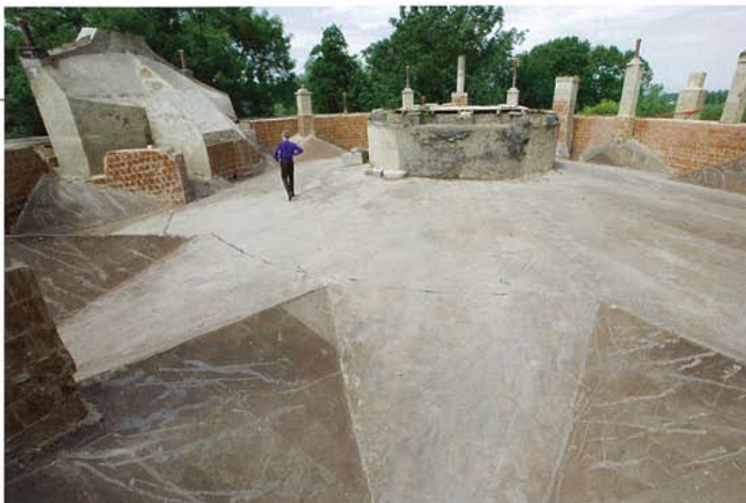
Om het dak te repareren werd het grondlichaam van het torenfort verwijderd. Tot ieders verrassing kwam een imposant daklandschap tevoorschijn. De idee is om het dak open te houden, en toegankelijk te maken voor educatieve doeleinden.

der het adagium 'behoud door ontwikkeling' werd de intentie uitgesproken om cultuurhistorie als volwaardig instrument bij de inrichting van Nederland te betrekken. De waterlinie werd aangewezen als Nationaal Project en planologisch verankerd als een van de twintig Nationale Landschappen in de Nota Ruimte. Op 12 december 2008 kende de ministerraad 35 miljoen euro uit rijksmiddelen toe voor het herkenbaar en beleefbaar maken van de linie. Door de provincies Utrecht en Gelderland is dit bedrag verdubbeld tot een totaal van 70 miljoen euro. Met dit geld worden een aantal forten opgeknapt en wordt de linie op verschillende plaatsen