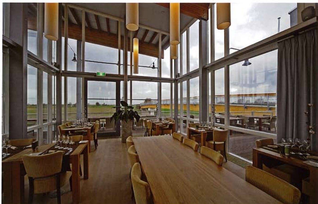
Restaurant met zicht op de brug en de Hollandse IJssel. In het interieur is veel eiken toegepast.