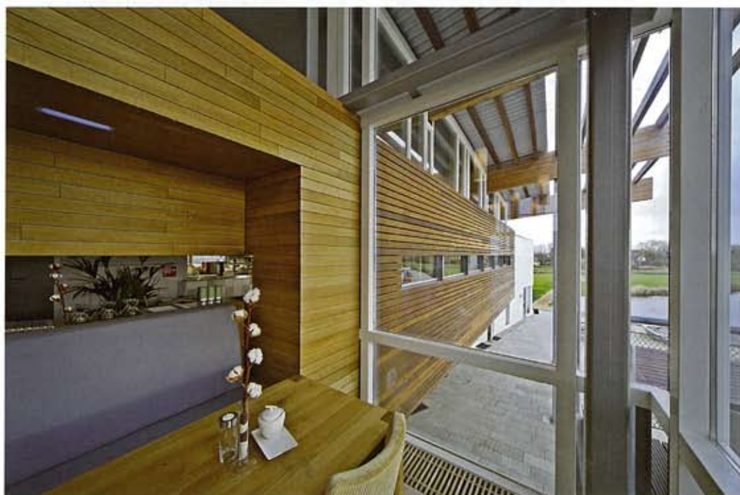
De horizontale gevelbekleding van cumaru loopt van binnen naar buiten door.