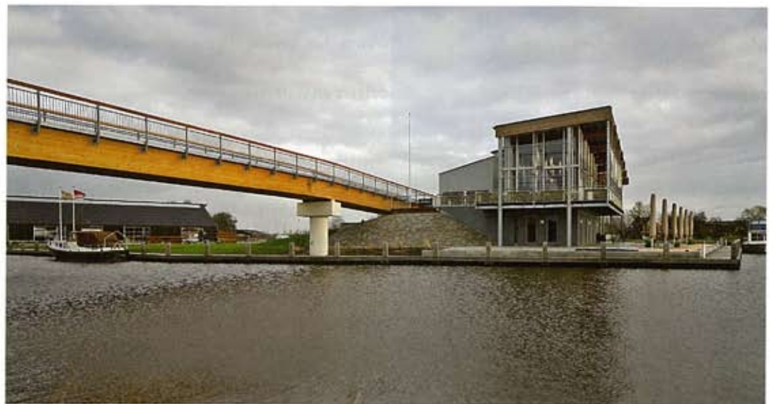
De brug komt uit bij de eerste verdieping van uitspanning Marnemoende, waar ook het restaurant is.