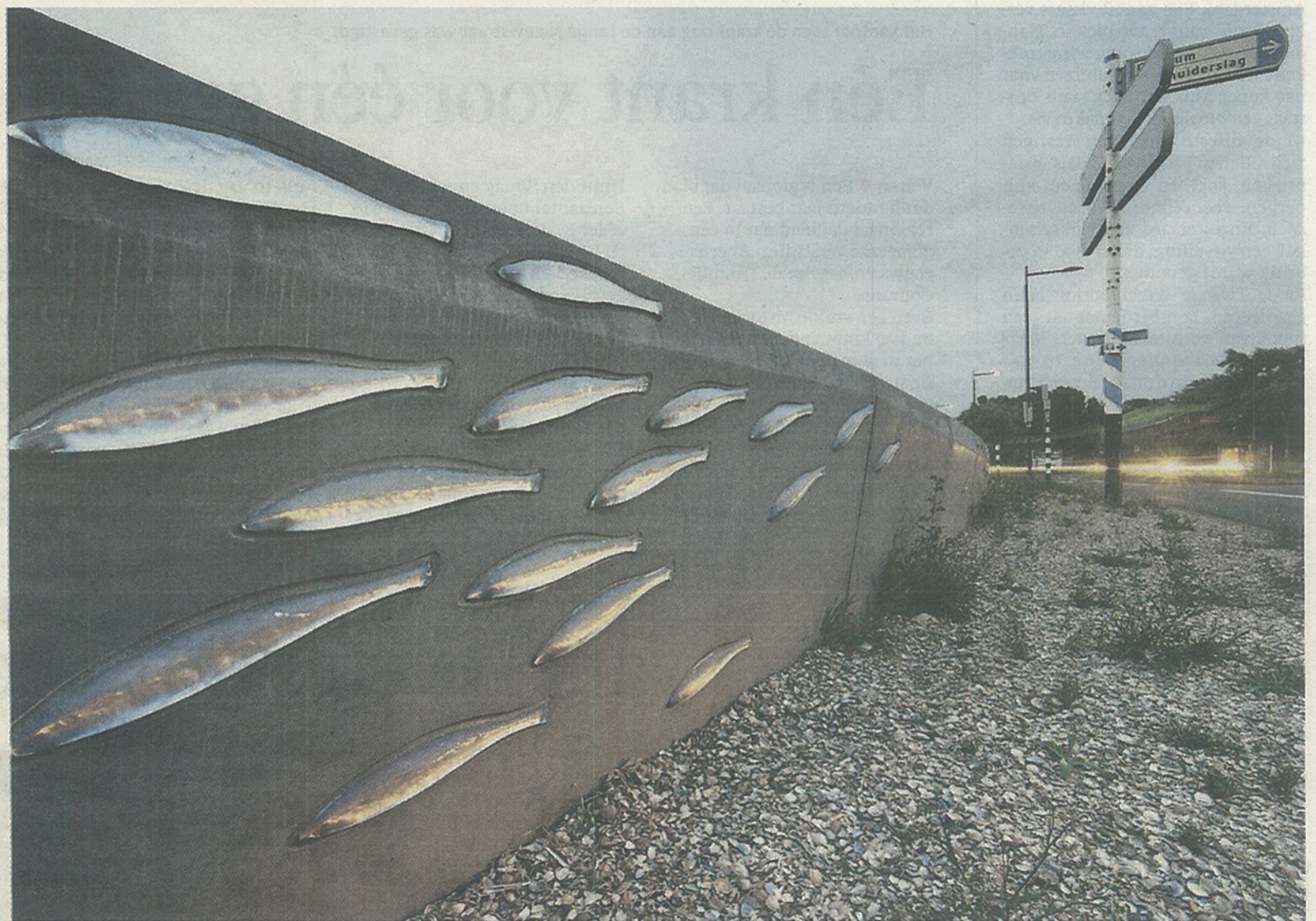
De muur met de visjes.

En die vis? Die rol je niet in een website.