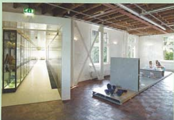
Ex- en interieur van het door Bureau SLA verbouwde Glasmuseum, foto: Jeroen Musch

Recente experimenten van kunstenaars en modemakers worden getoond in 'Op het lijf geblazen'. De religieus geïnspireerde schilder Marc Mulders maakte een grote installatie, The Seven Last Words of Christ , bestaand uit vogels, vlinders, schedels en doornen. Een retrospectief in 90 objecten is een hommage aan de nu 90-jarige Floris Meijdam, tussen 1949 en 1984 hoofdontwerper bij de fabriek.