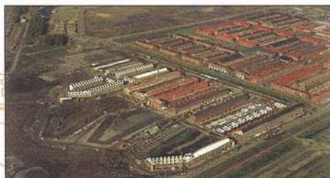
Deelgebied 2 van VINEX-locatie Ypenburg. Stratenplan waart uit van rechthoekig naar plooiën aan de waterkant.