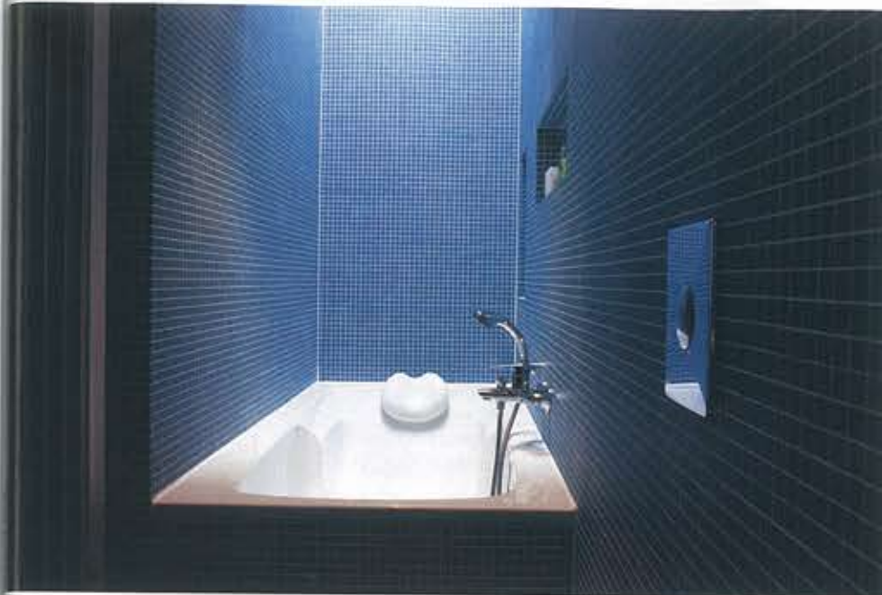
Verander de indeling: badkamer 'Full Moon' in een voormalige berging door Bureau SLA.

Oke, het is 'maar' een dakkapel of een serre. Maar onderschat de architectonische meerwaarde van een verbouwing niet. Een goed voorbeeld is de jarenzestiggezinswoning aan het Nassauplantsoen in Soest, die architecten Rooijackers en Tomesen voorzagen van een strakke houten aanbouw met kekke corten stalen raamkozijnen. 'Het was zo'n typische twee-onder-een-kapper,' aldus Rooijackers, 'daar zijn er honderdduizend van in Nederland.' Tomesen: 'Door toevoeging van een extra meter uitbouw zijn er compleet andere ruimtes ontstaan, terwijl we wel met de bestaande fundering konden werken.' Rooijackers: 'Zeker in de crisis denken mensen snel: ja, maar de makelaar zei, als je het straks wilt verkopen... Ik geloof niet in het zoveelste huis met een suffe aanbouw eraan vastgeplakt zonder ruimtelijke en estheti-