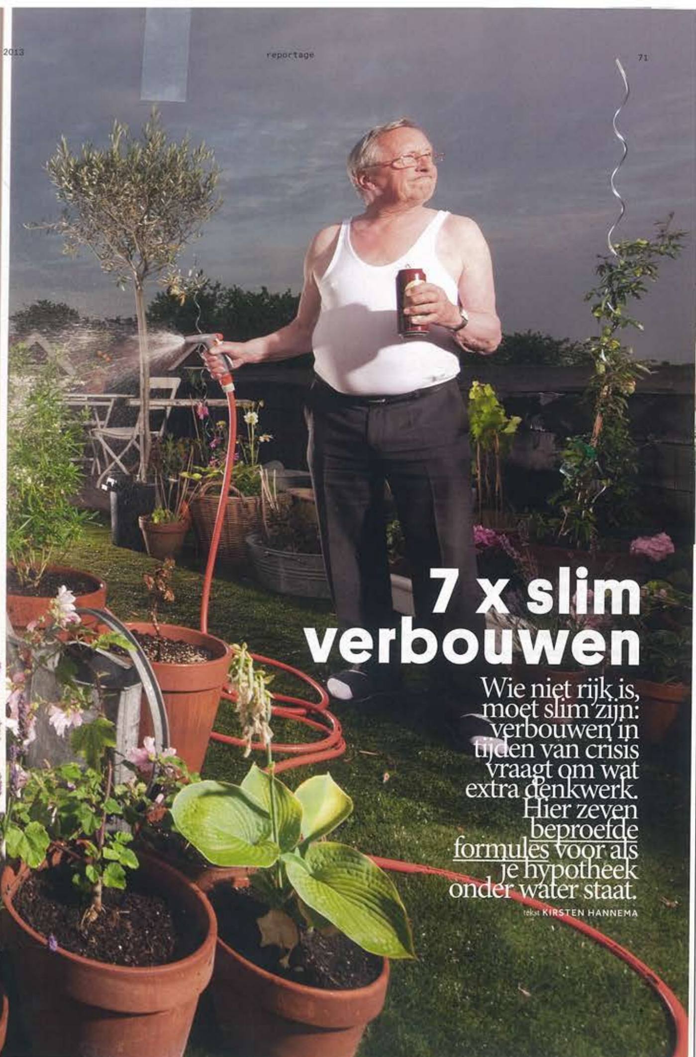
ONTWERP STUDIO ROUË FRANK, ZECC ARCHITECTEN.