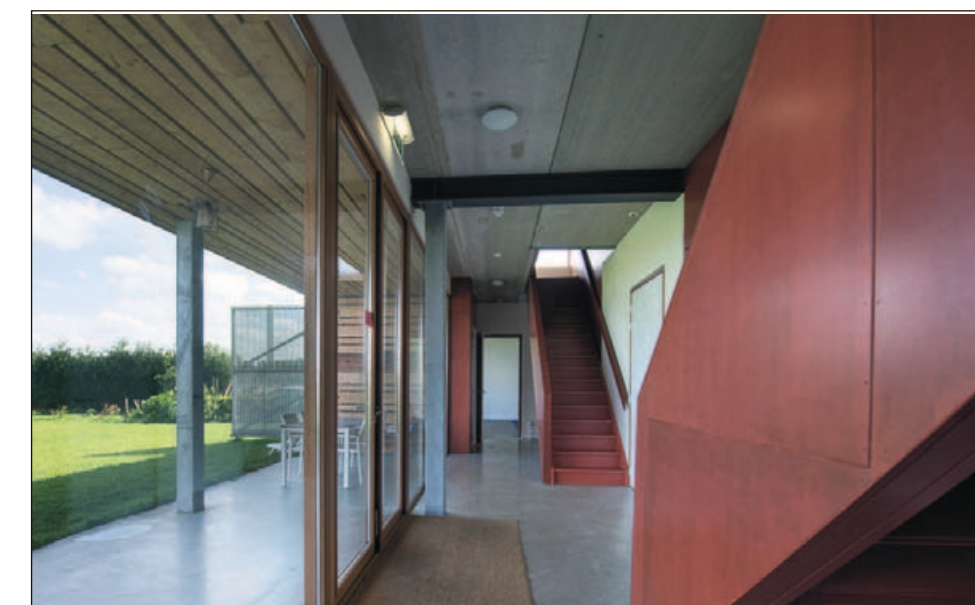
De hal met glazen wand, twee trappen naar de verdieping en een overdekt terras.