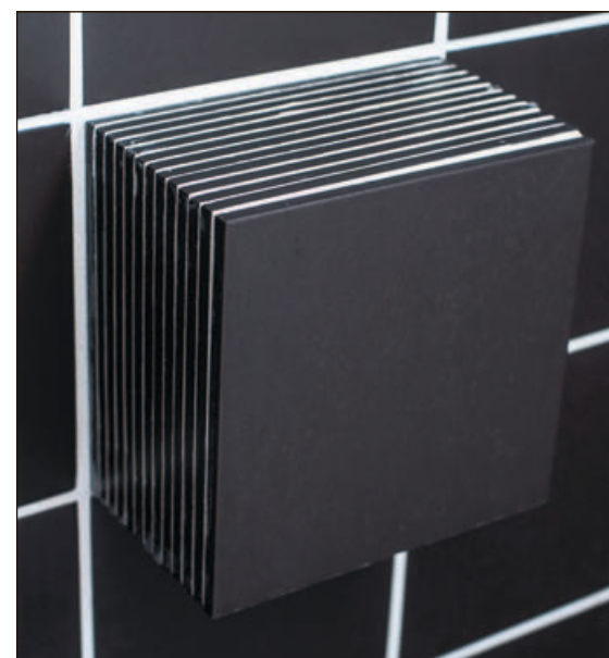
Gelijmde tegels in de douche voor shampoo